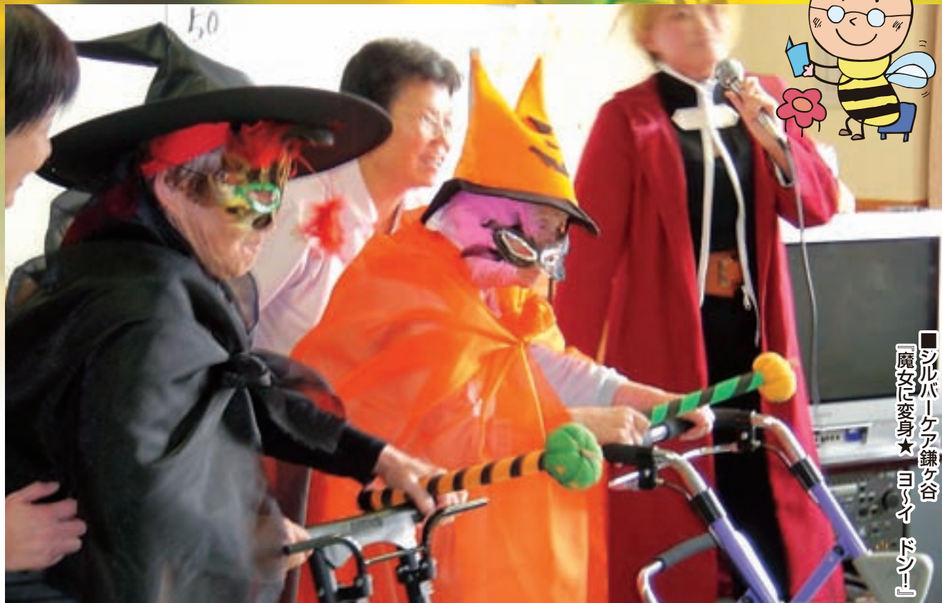
■シルバーケア鎌ヶ谷 『魔女に变身★ヨロイドン』