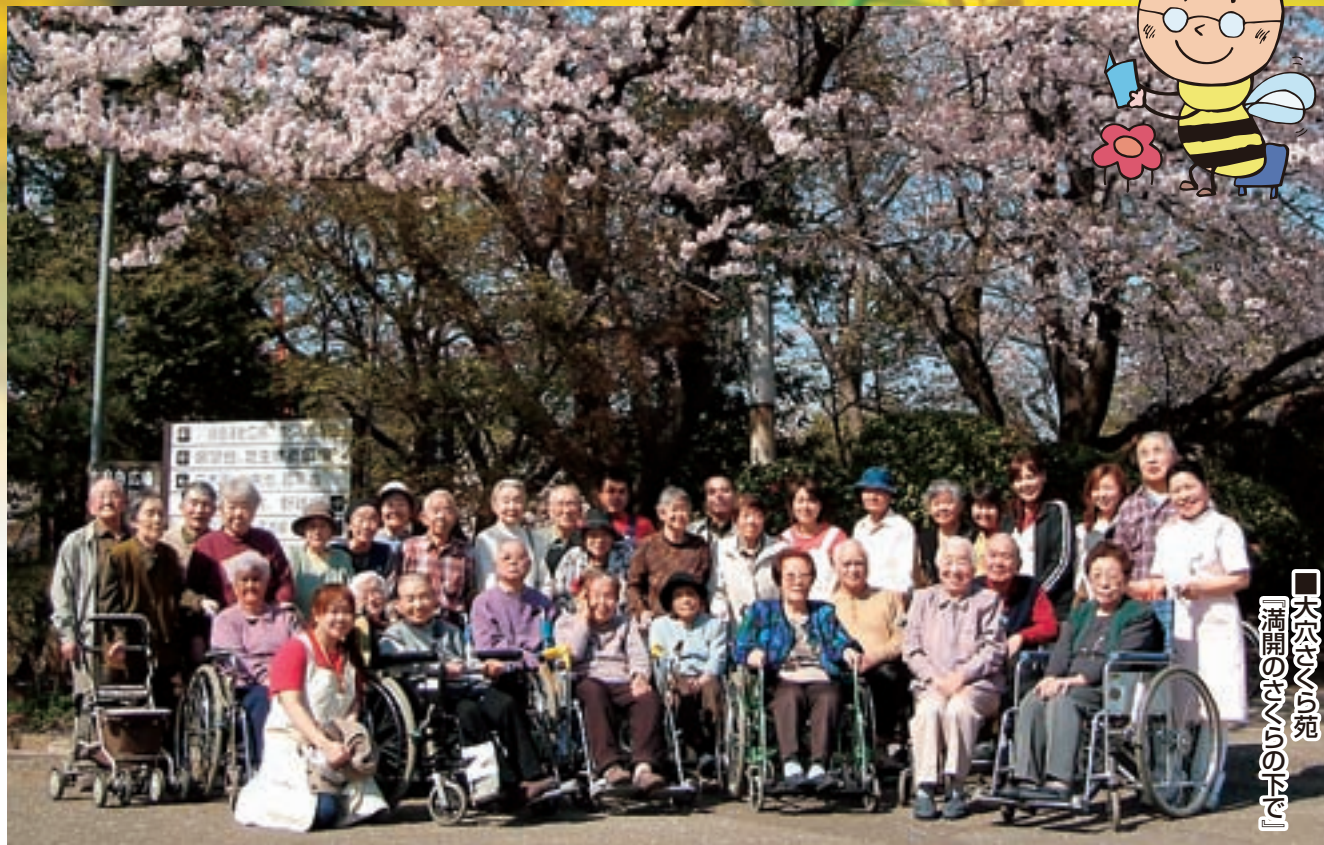
■大宮くら苑 『満開の桜の下に』