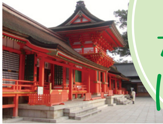
※写真は宇佐神宮です。