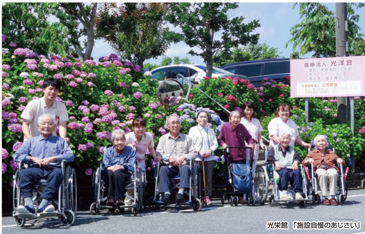
光栄館 「施設自慢のあじさい」