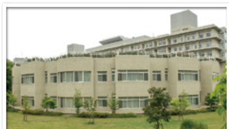
東京北医療センター介護老人保健施設 さくらの杜

住所 東京都北区赤羽台4-1-7-156 電話 03-5963-4187 開設 平成16年4月 入所 100名(ショートステイ含) 通所 60名