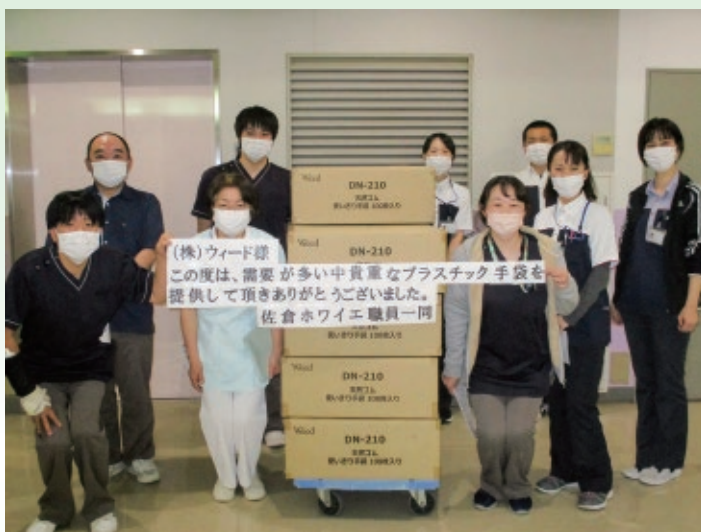
佐倉ホワイエ様からお礼の写真が届きました