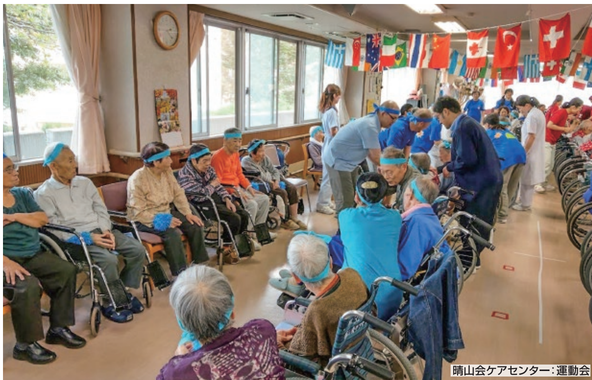
晴山会ケアセンター：運動会